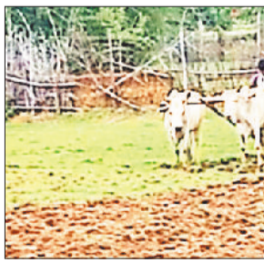
खेती-किसानी में जुटे किसान।

बारिश की शुरूआत होने के साथ ही किसान जोत तैयार कर धान का नर्सरी तैयार करने में जुट गए। ज्यादातर किसानों के द्वारा हाईब्रीड धान बीज का उपयोग करते हैं, जिसे रोपा पद्धति से खेती करने से फसल उत्पादन अधिक होता है। यही कारण है कि ज्यादातर किसान जोत तैयार करने में जुटे हैं, ताकि धान की नर्सरी तैयार कर सकें, लेकिन कई किसान ऐसे हैं जो शुरूआती बारिश में ही जोत तैयार कर धान की नर्सरी तैयार करने के कार्य पूरे कर चुके हैं।