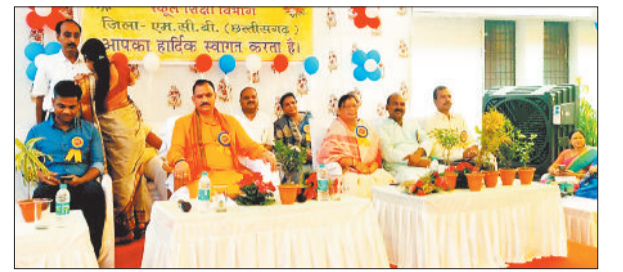
शाला प्रवेशोत्सव में शामिल स्वास्थ्य मंत्री व अन्य।

हटाया गया। इसके बाद यह मार्ग खाली हो गया और वाहनों की आवाजाही शुरू शेष पेज 4 पर