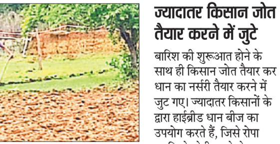
गई, जिनके द्वारा वर्तमान में हुई अच्छी बारिश के बाद रोपा कार्य शुरू कर दिए हैं।