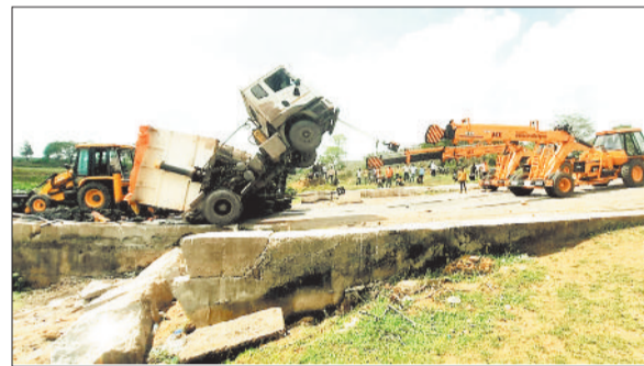
क्रेन और जेसीबी की मदद से हटाया गया वाहन।