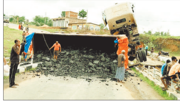
सड़क पर बिखरा कोयला।