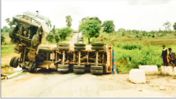
धनुहर नाला में पलटा हाड़वा।

जानकारी के अनुसार इस पुलिया पर प्रतिवर्ष कई वाहन दुर्घटना के शिकार होते हैं। बीती रात्रि फिर धनुहर नाला में फिर एक लोडेड वाहन अनियंत्रित होकर पलट गई, लेकिन इस घटना में वाहन चालक एवं क्लीनर सुरक्षित बच गए। यह घटना 5-6 जुलाई की दरमियानी रात्रि में घटित हुई। धनुहर नाला के एक छोर में ही वाहन के पलट जाने से इस मार्ग पर आवाजाही करीब 12 घंटे से अधिक समय तक बाधित रहा। इस दौरान नाला के दोनों ओर वाहनों की कतार लगी। काफी मशकत के बाद पलटे हाड़वा वाहन को हटाया गया, इसके बाद आवागमन सुचारू रूप से शुरू हो पाया। घटना के संबंध में मिली जानकारी के अनुसार बीते 5-6 जुलाई की रात्रि में कोयले से भरा 18 चक्का हाड़वा वाहन बैकुंठपुर की ओर आ रहा था। इसी दौरान बैकुंठपुर बिलासपुर मार्ग पर करीब 10 किमी की दूरी पर स्थित ग्राम मनसुख का धनुहर नाला पार कर जैसे ही चढ़ाई करने लगा, इसी दौरान कोयले से भरा भारी वाहन अनियंत्रित होकर बेक होने लगा, जिससे कि वाहन अनियंत्रित होकर पलट गई। इससे वाहन का सामने