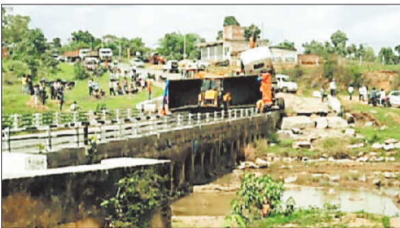
वाहनों की लगी कतार।